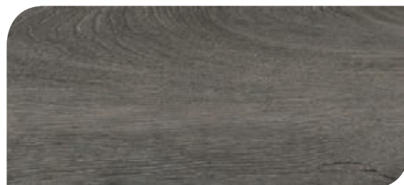
Cod. H04/003282 - Rovere Grigio