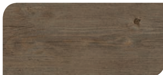
Cod. H04/002482 - Rovere