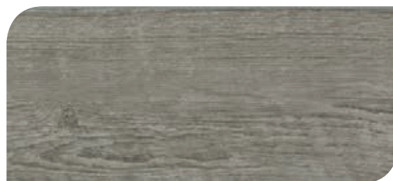
Cod. H04/002478 - Sbiancato Antico