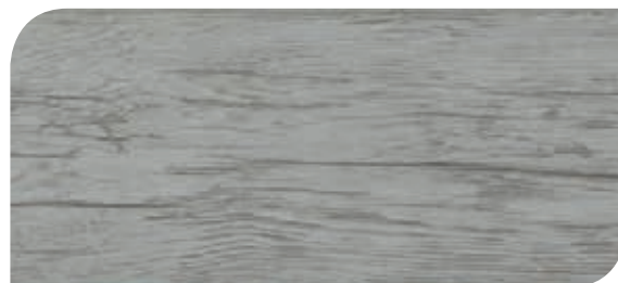
Cod. H04/001148 - Rovere Sbiancato